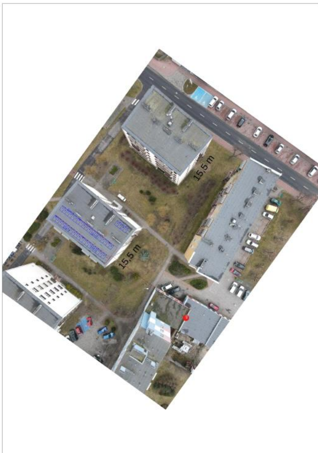
Figura 2: Umieszczenie generatora fotowoltaicznego i grupy konwersji